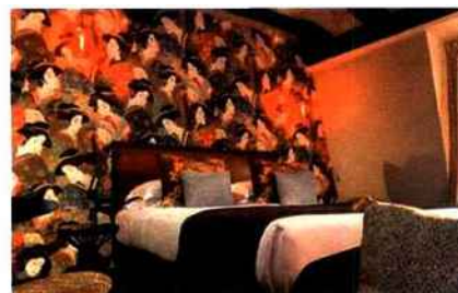
Au 6 e étage, on s'envole pour l'Asie, sur les traces de Marguerite Duras .