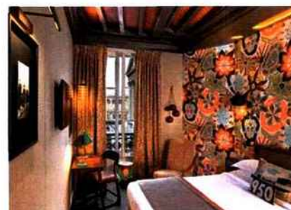
L'étage consacré à Edith Piaf plonge avec exubérance dans les années 1950.