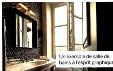
Un exemple de salle de bains à l'esprit graphique.

Asie, terre d'inspiration de Marguerite Duras . Résultat : des luminaires aux allures de lampions, des tentures murales envahies de dragons ou de geishas... Dépaysement garanti. ■