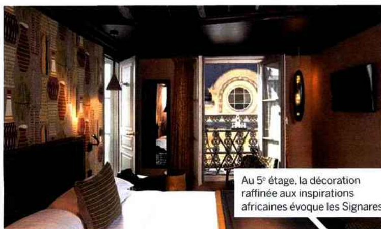
Au 5 e étage, la décoration raffinée aux inspirations africaines évoque les Signares .