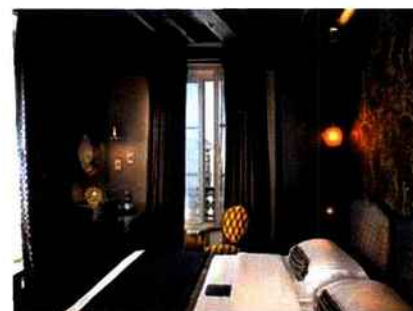
Atmosphère jazzy et feutrée dans les chambres Juliette Gréco .